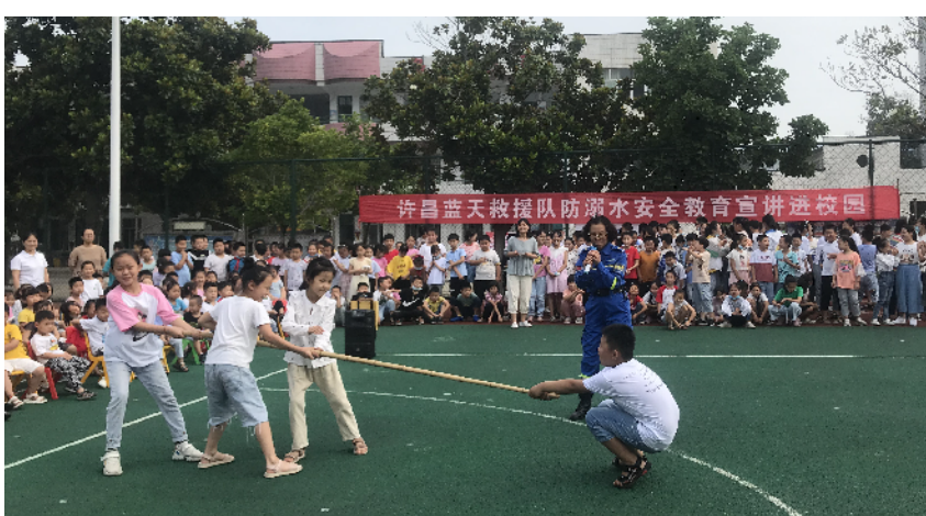
现场演示遇到他人溺水后的正确施救方法。

老师们兴致勃勃地交流、比较,进一步了解孩子的不同,接受学生的不同。沙龙结束后,老师们表示,此次活动联系实际,从身边的问题入手,让他们对学生心理健康教育有了深入的认识,对今后开展心理健康工作有很大帮助。