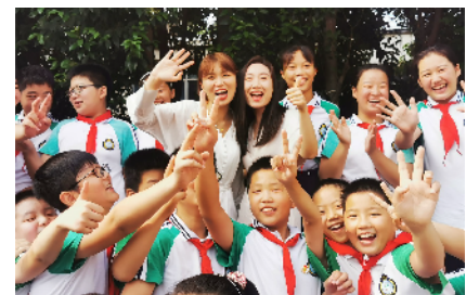
师生快乐合影留念。