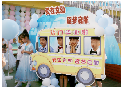
和“小同窗”合影留念。