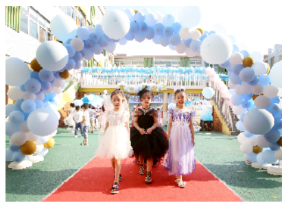
合张影,留下美好回忆。