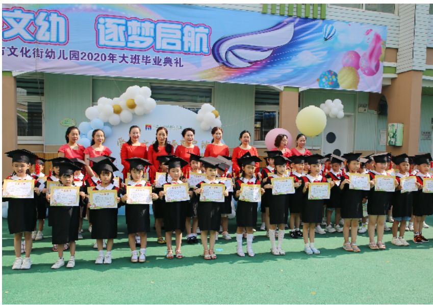
穿上小小“博士服”,拍张毕业照。

通过此次毕业活动,大班幼儿体验了与老师、同伴、父母一起参与活动的乐趣,体验了长大的快乐,也增进师生、同伴、家园互动之情。