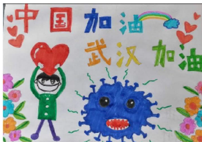
市文化街幼儿园 大五班 张皓轩 (辅导老师 高英杰)