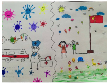
市文化街幼儿园 大四班 白雨欣 (辅导老师 周素华)