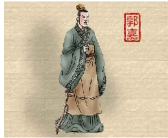
郭嘉画像 资料图片

郭嘉(公元170年-207年),字奉孝,颍川阳翟(今河南禹州)人。东汉末年曹操帐下著名谋士。