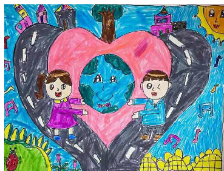
东城区实验学校 一(4)班 牛嫣然