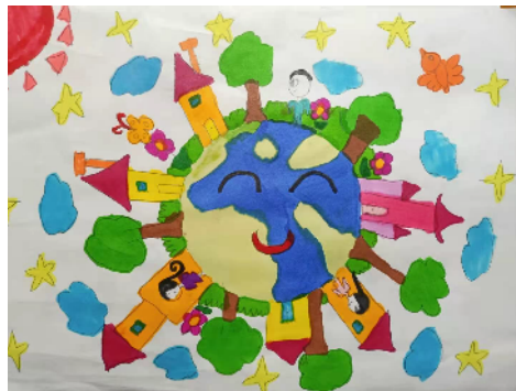
市健康路小学 二(6)班 张沐阳