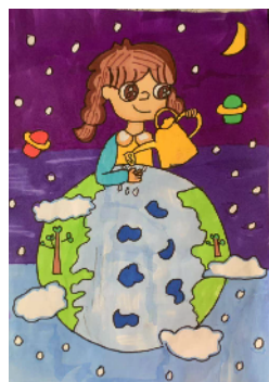
市兴华路小学 四(1)班 李蕊芬