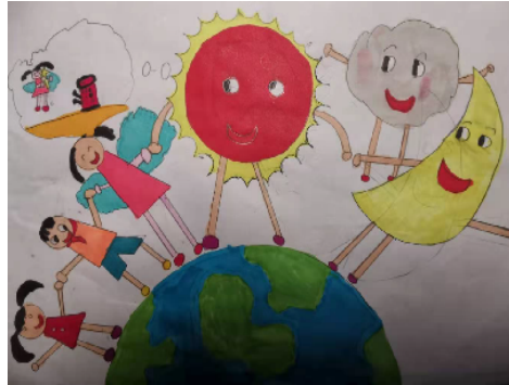
市南海街小学 二(1)班 吴欣桐