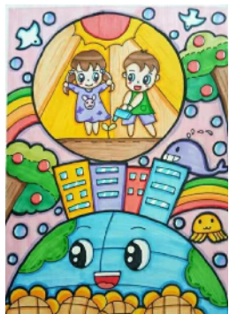
市南海街小学 四(4)班 齐成斐