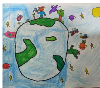
市健康路小学 一(2)班 李梓祺