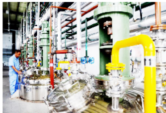
禹州市天源科技生物有限公司的工人正在察看生产情况。

作为我市近年来重点培育发展的4个战略性新兴产业之一,生物医药产业也具备较好的产业基础,目前已经形成涵盖化学药制造、中药加工、生物保健品、生物制药、生物医学工程等领域的生物医药产业体系,特别是谋划建设了许昌市生物医药产业园、禹州市医药健康产业园、建安区精细化工园区等产业园区,培育引进了津药瑞达、天源生物、河南豫辰、振德敷料等龙头骨干企业。