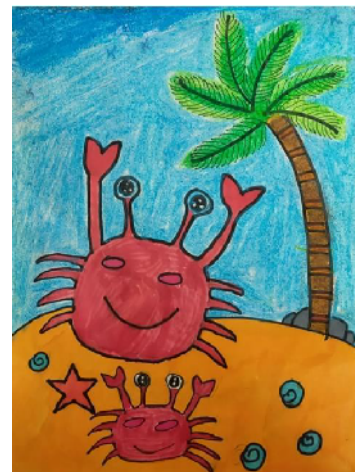
鄢陵县金汇实验小学 三(1)班 闫梓默 (辅导老师 马慧珍)