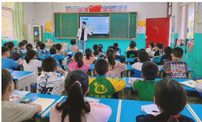
班会课上,师生一起展望新学期。