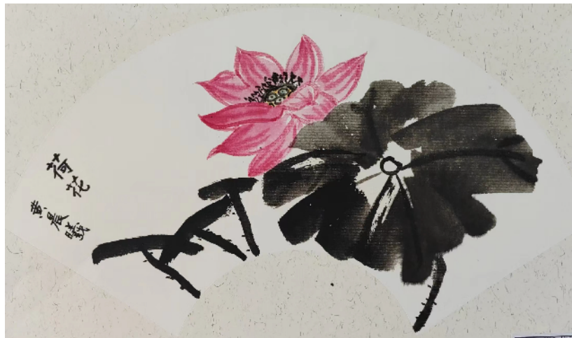
建安区镜水路小学 四(5)班 黄晨曦