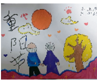
市新兴路学校 三(3)班 孙悦冉