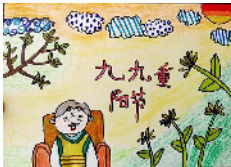
市大同街小学 二(1)班 李文茜