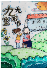
建安区魏风路小学 五(4)班 程心怡