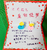
魏都区实验学校 二(5)班 曹艺彤