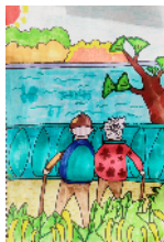
市大同街小学 三(1)班 张艺然

小读者们,如果你喜欢画画,可以画出一幅成语的内容,发送到小记者微信公众号里,快来投稿吧!