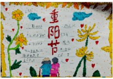
市新兴路学校 二(1)班 吉若茜