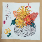
禹州市韩城西街小学 二(1)班 董沫冉