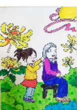
市古槐街小学 四(4)班 秦一诺