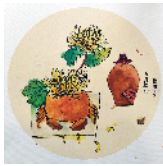
市学府街小学 三(1)班 杨蕙瑜