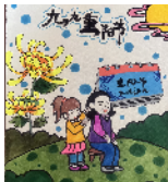
市南海街小学 二(6)班 周豪翔