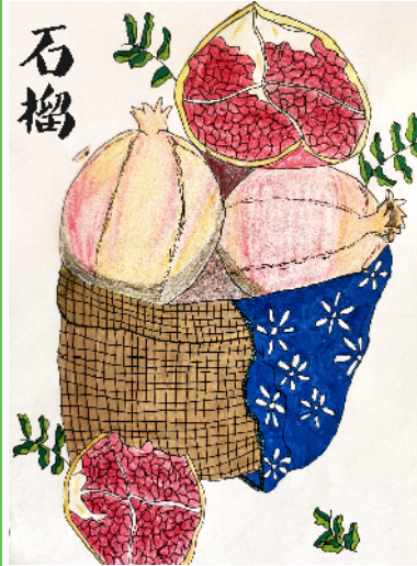
魏都区文华小学 六(1)班 刘佳仪 （辅导老师 魏宝荣）